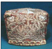
Русский кокошник XIX век. ТОКМ.