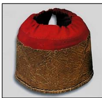
Сарауц, Сибирские татары. XIX век. ТОКМ.