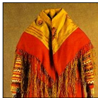
Фрагмент праздничного костюма манси.

Красный цвет – цвет крови, а значит и цвет жизни. Символизирует любовь к человеку, к жизни. Красный – прекрасный, т.е. символ красоты, молодости, жизненной энергии.